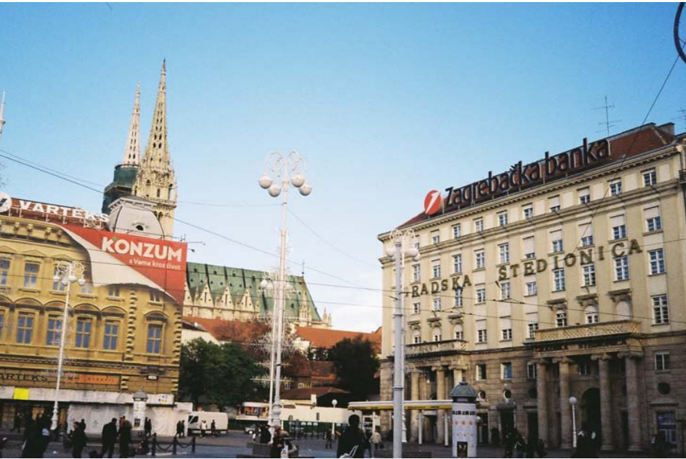
Zagreb Trg Bana Jelačića